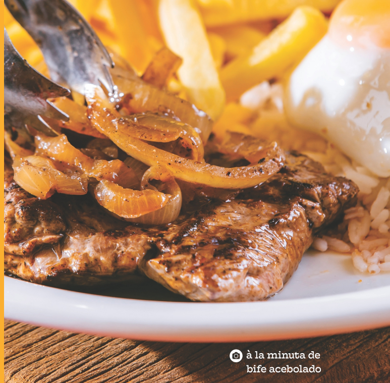
☉ à la minuta de bife acebolado