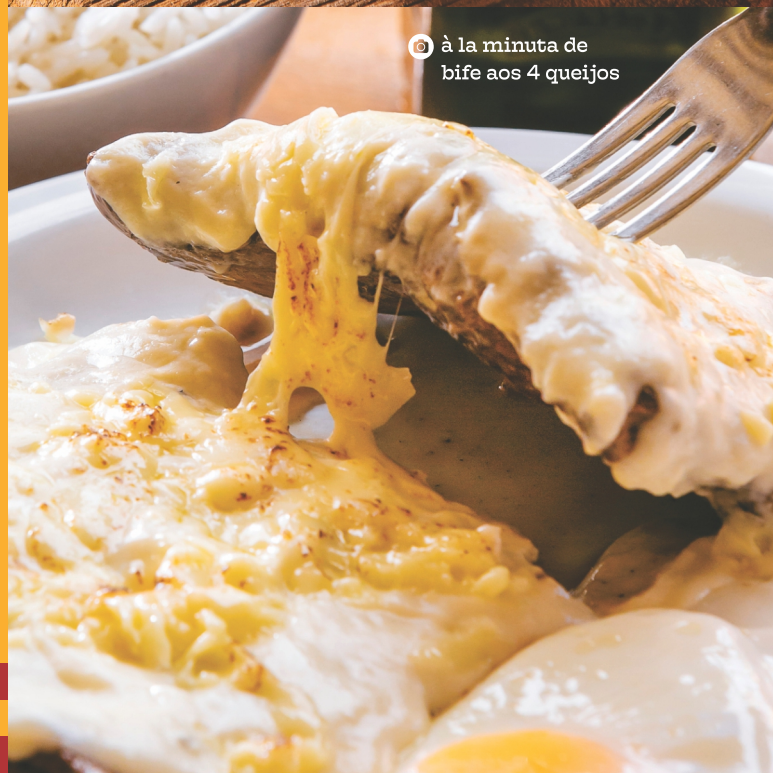
☉ à la minuta de bife aos 4 queijos